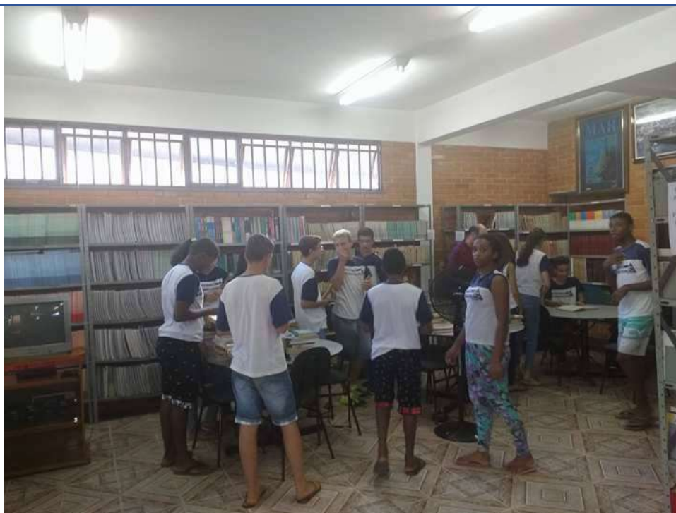
Foto 01: Momento conhecimento. Data: 15/05/2017