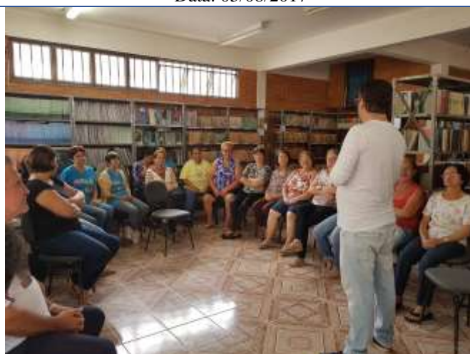
Palestra ministrada Autoria: Jéssica Moura de Pina Data: 05/08/2017