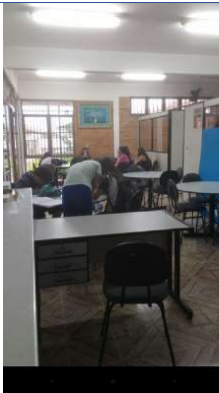
Foto 04: Curiosidades da história do Município. Data: 15/05/2017