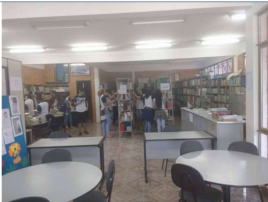
Foto 02: Alunos pegando livros. Data: 15/05/2017