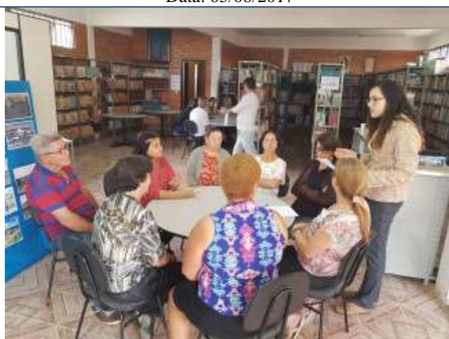
F Palestra ministrada Autoria: Jéssica Moura de Pina Data: 05/08/2017oto 01: Momento conhecimento.