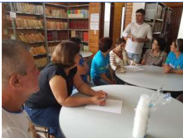
Palestra ministrada Autoria: Jéssica Moura de Pina Data: 05/08/2017