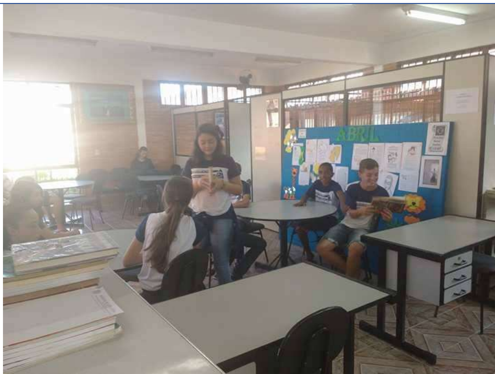
Foto 03: Compartilhando conhecimento. Data: 15/05/2017